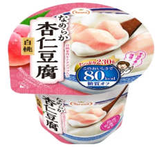
Taramiなめらか 杏仁豆腐白桃 230g 1個で80kcal

参照:日本食品標準成分表(八訂)増補2023年 80kcal分の重量にカットし撮影